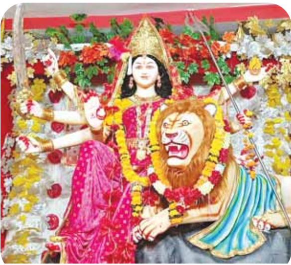
सार्वजनिक दुर्गात्सव समिति दुर्गा मंदिर बस स्टैण्ड, ढीमरखेड़ा।