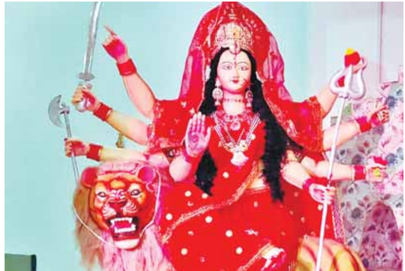
पिंडरई कालोनी में विराजी मां दुर्गा।