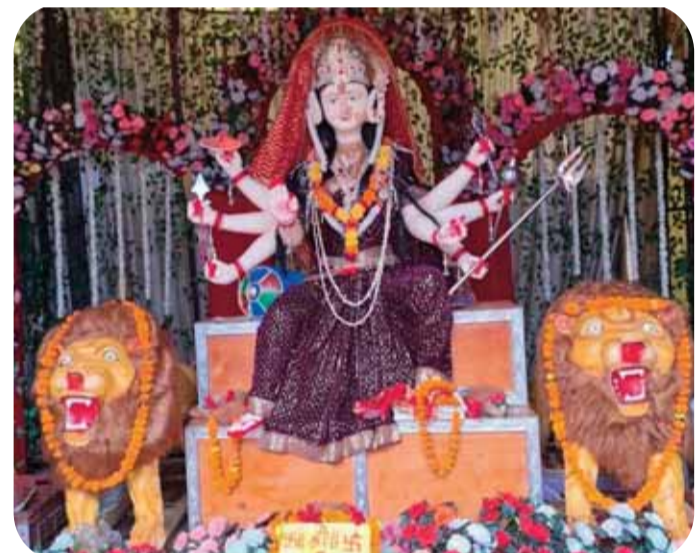
नगर सेठानी दुर्गा उत्सव समिति स्लीमनाबाद तिराहा।