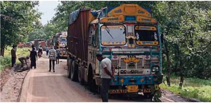
हरिभूमि न्यूज | सिंग्रामपुर/जबेरा

दमोह-जबलपुर स्टेट हाईवे पर सिंग्रामपुर के सतघटिया जंगल क्षेत्र में रविवार सुबह एक ट्रक का अगला चक्का गहरे गड्ढे में धंसकर पट्टा टूट जाने से लगभग 4 किलोमीटर लंबा जाम लग गया। यह स्थिति एक माह में दूसरी बार बनी है। खस्ताहाल सड़क और लगातार वाहनों की खराबी के चलते पांच घंटे तक यातायात पूरी तरह बाधित रहा। अंततः जबेरा और सिंग्रामपुर पुलिस की कड़ी मशकत के बाद हाईवे पर आवागमन बहाल हो