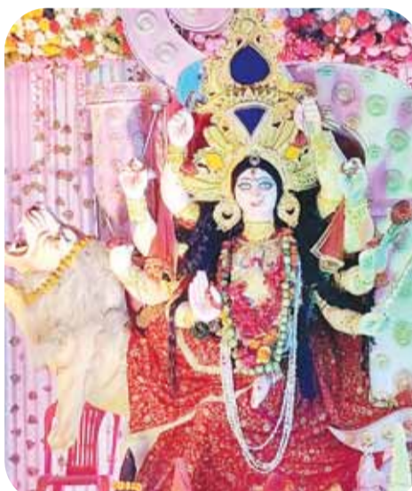
संगम नगर दुर्गात्सव समिति स्लीमनाबाद तिराहा।