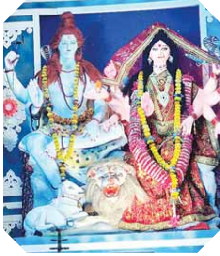
पटेरा। जय बजरंग दुर्गात्सव समिति बस स्टैंड