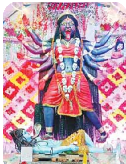
मुरवारी बाजार मोहल्ला में विराजी मां काली।