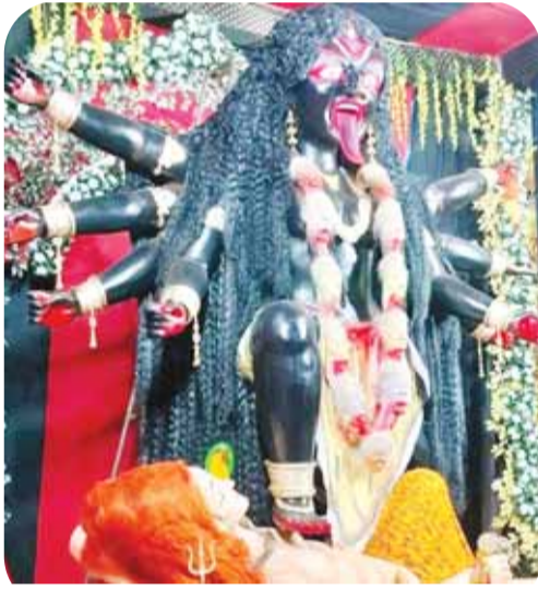
नगर महारानी दुर्गात्सव समिति स्लीमनाबाद।