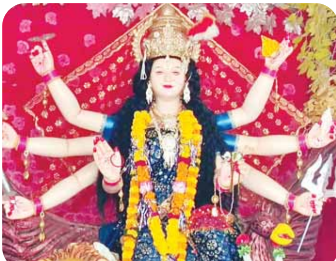
सार्वजनिक दुर्गा उत्सव समिति बरेली।