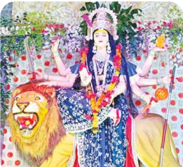
सार्वजनिक दुर्गा उत्सव समिति हनुमान मंदिर ढीमरखेड़ा।