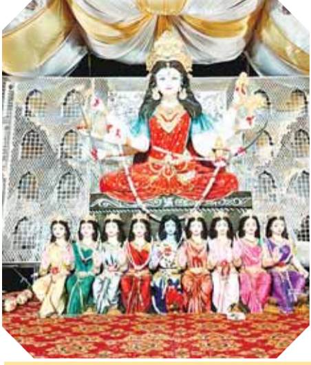
दमोह। राय चौराहा पर विराजित माँ की मनमोहक छवि

जिले में जगह जगह अदभुत झांकियां, संध्या आरती में उमड़ रहे श्रद्धालु