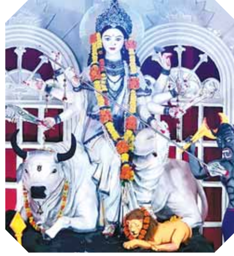
पटेरा। पुराना बाजार दुर्गात्सव समिति