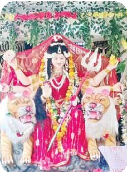
सार्वजनिक दुर्गात्सव समिति ब्लाक कालोनी ढीमरखेड़ा।