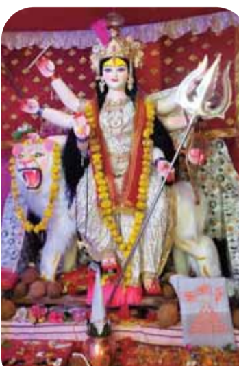
सार्वजनिक दुर्गात्सव समिति विरासन पाली।