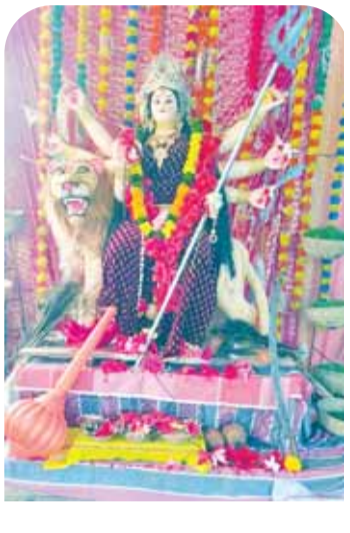
अचानक दुर्गात्सव समिति बरेली।