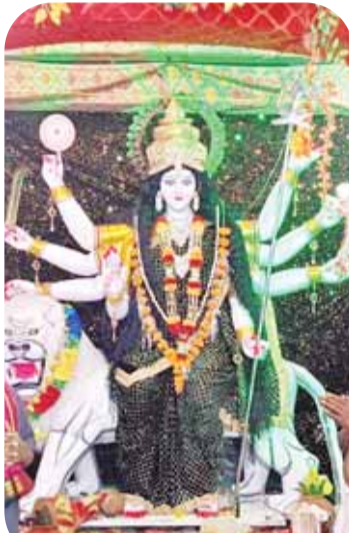
अंतर्वेद गनियारी वार्ड नं.16 में विराजी मां दुर्गा।